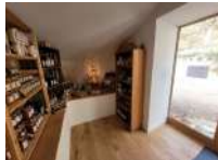
@Echoppe du Bosc