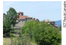
@OT Pays de Lamastre