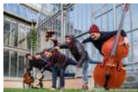
@Musiques aux sources