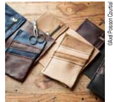
@Aval Pison Courail