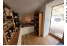
@Echoppe du Bosc