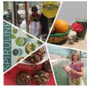
@Spiruline des Monts d'Ardèche