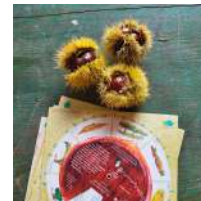
@Parc des monts d'ardèche