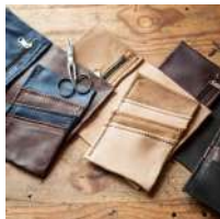
@Ael Pison Courral