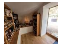
@Echoppe du Bosc