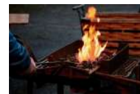
@Marché nocturne & Barbecue