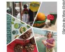
@Spiruline des Monts d'Ardèche