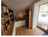
@Echoppe du Bosc