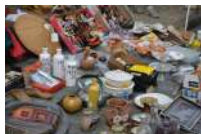
@CT Page de Lamastre