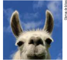
@larnas de la-bas