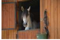
Office de Tourisme du Pays de Lamastre