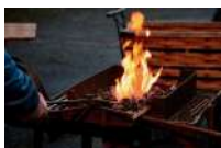
@Marche nocturne & Barbecue